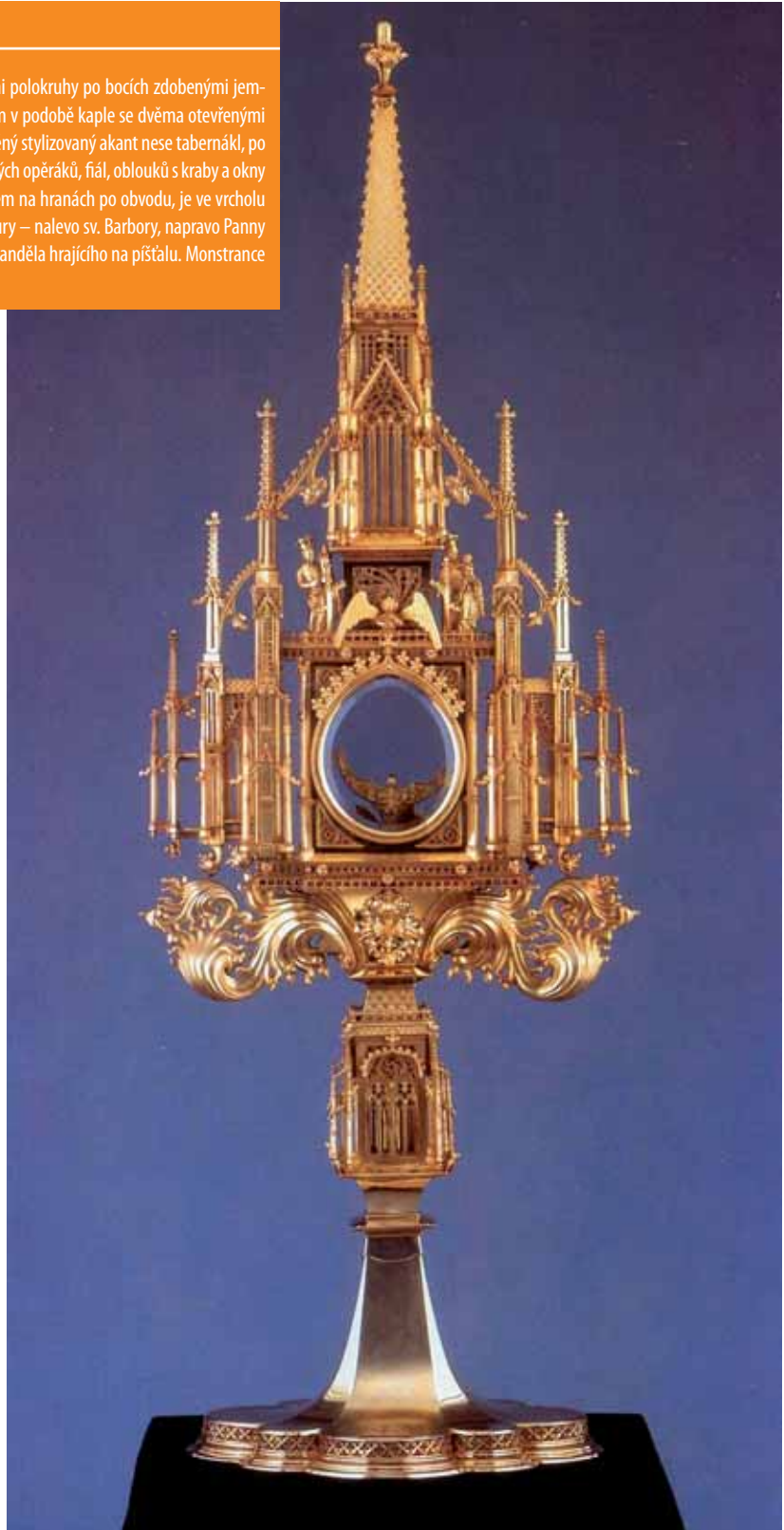
Michalská monstrance je klasickým představitelem gotického umění.