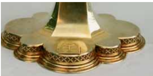
Značka na podstavci vedla k určení objednavatele monstrance.